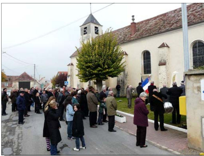
Ce 11 novembre 2009, beaucoup de Changissiens sont venus rendre hommage aux soldats de leur village morts pour la France.

Depuis le 11 novembre 1995, les Anciens Combattants de Changis-sur-Marne et leurs élus, les Anciens Combattants de Saint-Jean-les-Deux-Jumeaux et leurs élus, organisent ensemble les cérémonies commémoratives du 11 Novembre 1918 et du 8 Mai 1945.