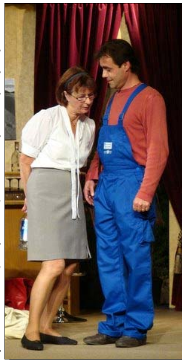
Deux des merveilleux comédiens de : « DRÔLES DE COUPLES »