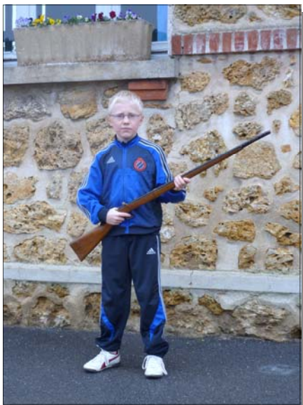
Un enfant de 2010 avec un authentique fusil de 1908.

pour les envoyer en manœuvres et exercices, hors du temps scolaire. Mais les menaces de guerre se précisent, je le sens. Et puis, M rs les Conseillers, la directive préfectorale que je viens de recevoir exige le respect de la loi. Pensons aussi à nos enfants, petits Lorrains ou Alsaciens, oublierons-nous qu'ils sont Allemands contre leur gré, à l'heure où je vous parle ?