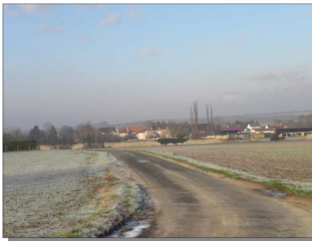
Un village de notre belle Brie, sous les frimas de l'hiver

En revanche, il nous semble utile de préciser même sommairement qui fait quoi.