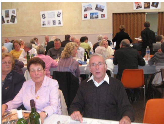
Ce repas du 18 octobre 2009 a vraiment été une réussite.

Au nom de tous les Changissois, le Centre Communal d'Action Sociale (CCAS) offrait ce dimanche le traditionnel « Repas de l'Amitié » aux Aînés de notre village.