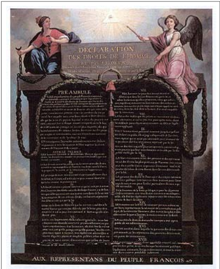
L'armature de notre Démocratie : La Déclaration des Droits de l'Homme et du Citoyen

Une année s'achève, une autre commence. Quel bilan, quelles résolutions, voilà bien là les questions essentielles qui méritent de prendre place dans ce bref billet.