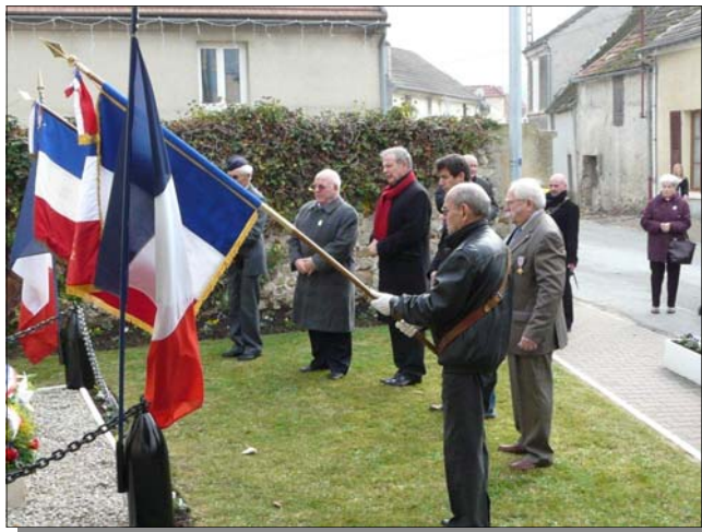
Un moment toujours plein d'émotions, l'appel aux morts...