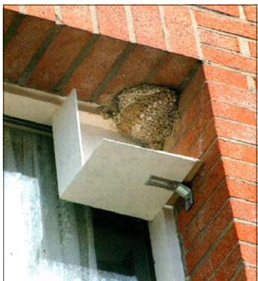
Nid et anti salissures en place.

La peine maximale encourue est de : 6 mois de prison et 9000 € d'amende.