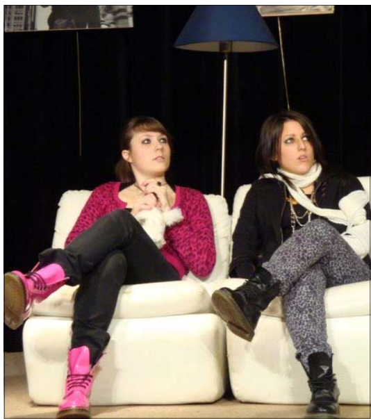
Deux comédiennes de « SALADE DE NUIT »

Rendez-vous en Novembre 2010 pour une nouvelle comédie qui sera... Je ne sais