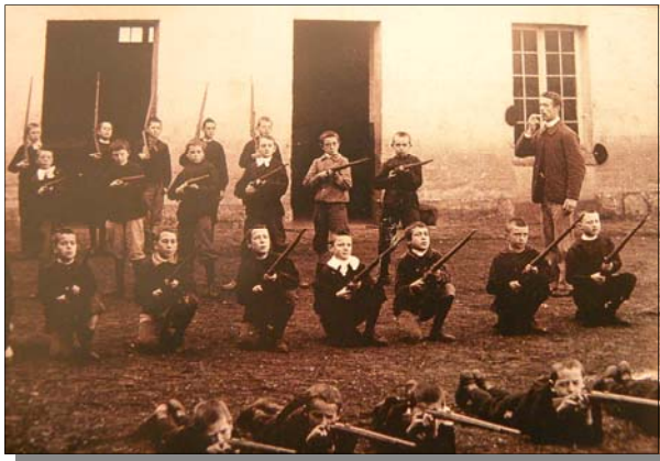
L'apprentissage de la guerre à l'école...