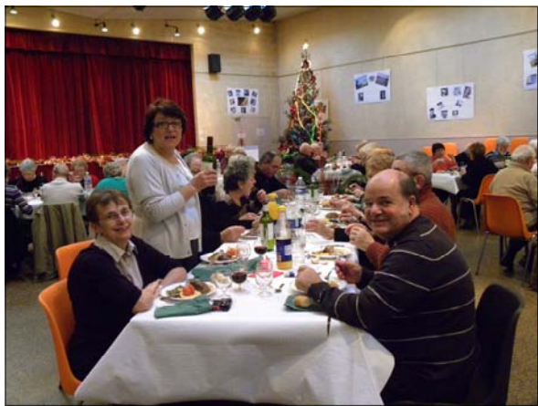
Pas de doutes, les convives sont ravis.

Le mardi 8 septembre, nous voilà repartis pour une « promenade » en Champagne. Le matin visite du château de Montmort, forteresse du Moyen Age devenue Château de la Renaissance. Il est un des plus beaux monuments historiques classés en Champagne. Notre déjeuner-croisière sur la Marne au départ de Cunières nous conduit à Reuil. Viennent ensuite la visite du domaine de Bacchus avec son musée du vignoble en miniature et la dégustation de champagne.