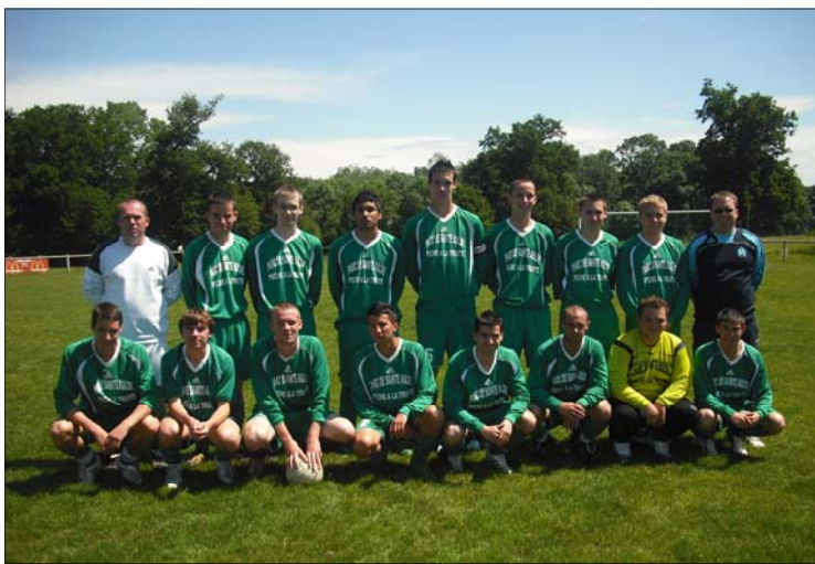
Une équipe de l'US. Changis-St. Jean-Ussy-Sammeron-Signy Signets

Année du Cinquenaire de l'US compte 212 licenciés répartis en 10 Equipes, des débutants aux plus de 45 ans.