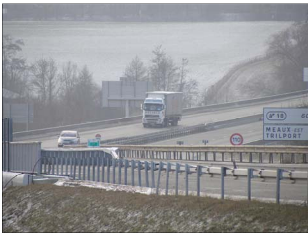
L'autoroute A4 au niveau de USSY sur MARNE

Afin de sauvegarder ce patrimoine une réforme est envisagée.