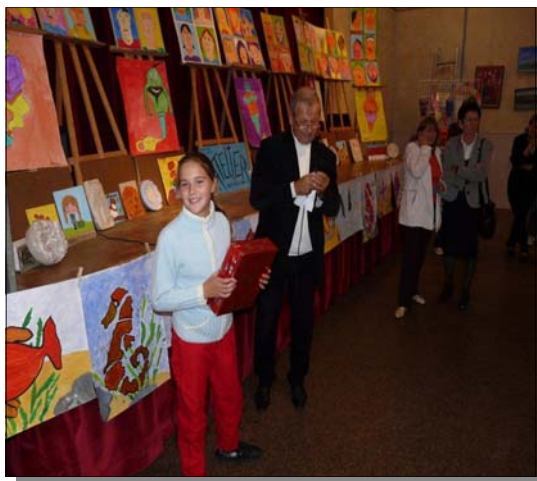
L'heureuse gagnante récompensée par M. le Maire.