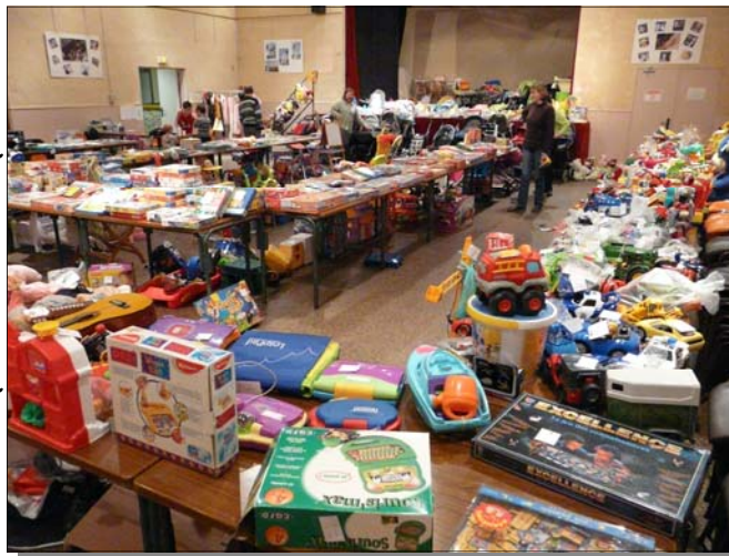
Cette bourse aux jouets fût une uraie réussite.

Les membres de l'Association et moi-même vous souhaitons une bonne et heureuse année.