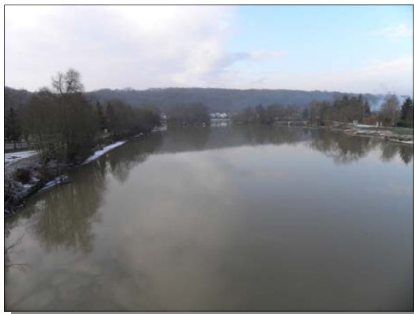
La Marne vue du pont de CHANGIS-ST JEAN

Faire en sorte que nos projets, qui tous ne seront réalisables que s'ils sont retenus et donc subventionnés, gagner le plus souvent ces compétitions est une des tâches principales de vos élus. Soyez assurés qu'ils s'y emploient sans relâche.