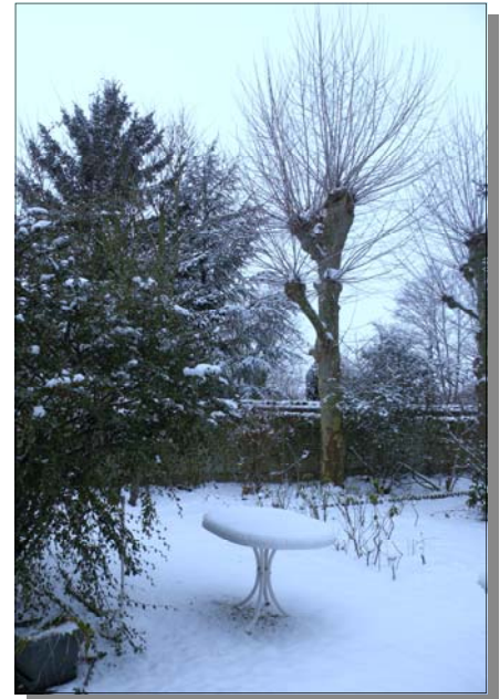
L'hiver est là, c'est le moment de préparer le printemps.

Nous voici en hiver... Vous avez protégé vos plantes les plus fragiles (paille ou feuilles au pied, voile d'hivernage bien fixé autour). Sans doute avez-vous aussi préparé votre terrain avec soin durant cet automne si doux et peut-être même avez-vous déjà effectué quelques plantations ? Il est grand temps, si vous ne l'avez pas encore fait, d'apporter un peu de « nourriture » à votre sol, de bêcher légèrement le pied des arbustes et... en avant petits et grands plantoirs, griffes et autres outils, pour planter anémones, renoncules, giroflées, myosotis pâquerettes, pensées et continuer la plantation des arbres à feuilles caduques s'il ne gèle pas et s'il ne pleut pas trop ! Il est temps aussi d'élaguer les grands arbres et de tailler pommiers, poiriers et autres arbres « à pépins ».