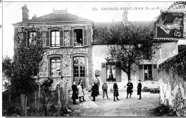
Notre Ecole dans les années 1874.