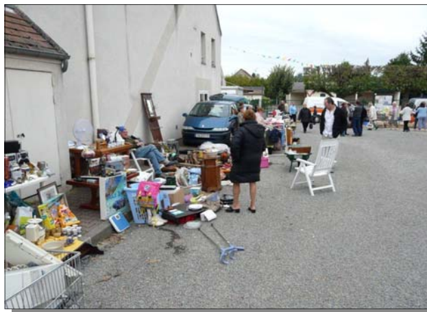
La brocante est ouverte, la chasse à l'objet rare commence.