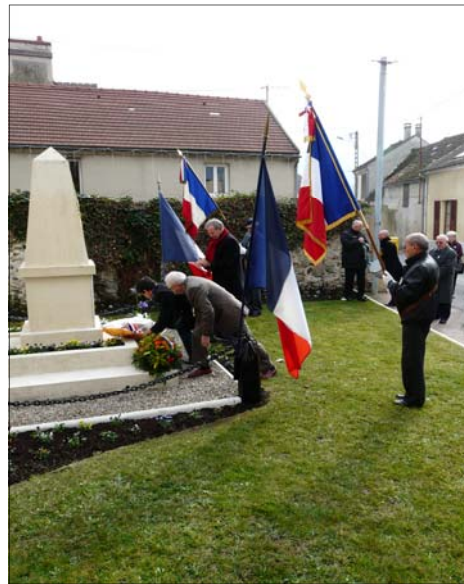
Dépose de la Gerbe du souvenir par les Jeunes Changissois.