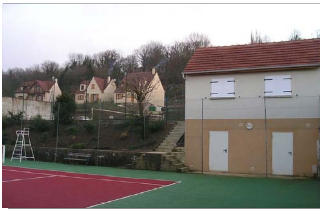
Les installations du club.