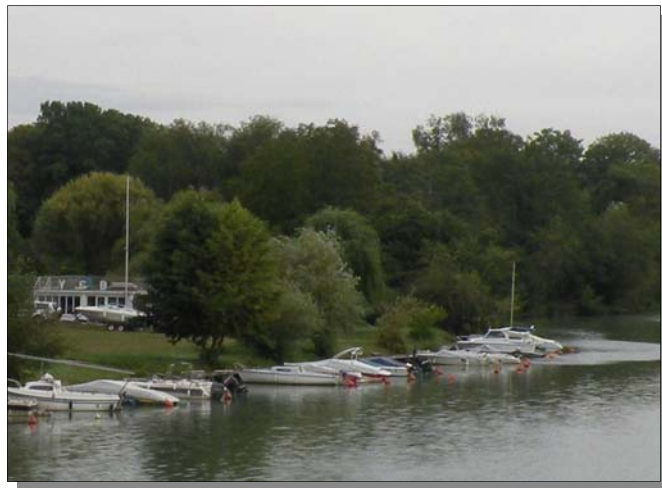
Quelques bateaux adhérant au YCB au mouillage.