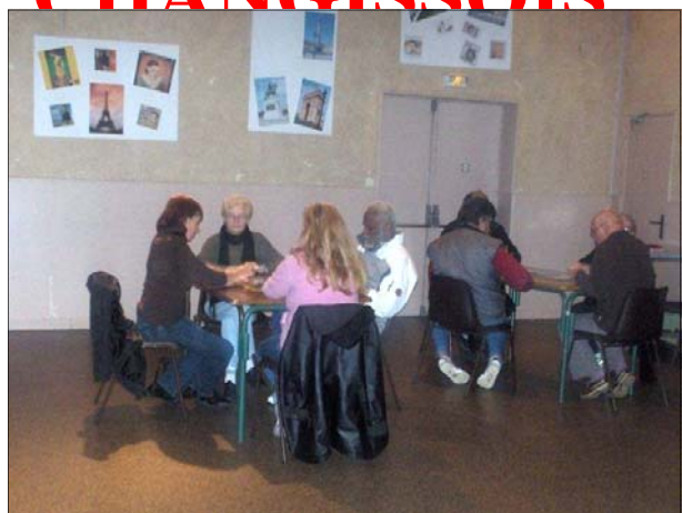
Les cartonneurs en pleine réflexion

Avec la nouvelle rentrée, « Les Cartonneurs Changissois » ont repris leurs activités du tarot. C'est avec un immense plaisir que cette « bande d'amis » se retrouve chaque vendredi soir pour passer ensemble d'agréables moments.