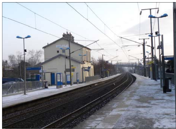
Les transports fluviaux, autoroutiers et ferroviaires, trois atouts majeurs incontournables au développement des régions de demain.

Pour conclure, historiquement, on peut aussi rappeler que les communes trouvent leur origine dans les paroisses, les départements sont nés de la Révolution Française. Quant aux régions créées en 1972, elles puisent leur source dans les provinces de l'Ancien Régime. On le voit, notre organisation territoriale doit beaucoup à l'histoire. Celle-ci a vu l'affrontement, le rapprochement, puis la synthèse de courants de pensées contradictoires allant du centralisme le plus jacobin à la vision d'une France décentralisée. Au fil du temps, ceux-ci ont radicalement transformé notre conception de l'organisation territoriale, la décentralisation s'intégrant à notre patrimoine commun.